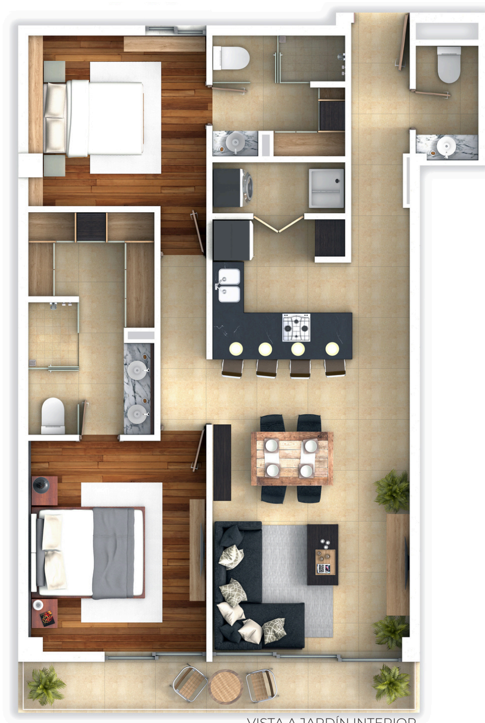
VISTA A JARDÍN INTERIOR