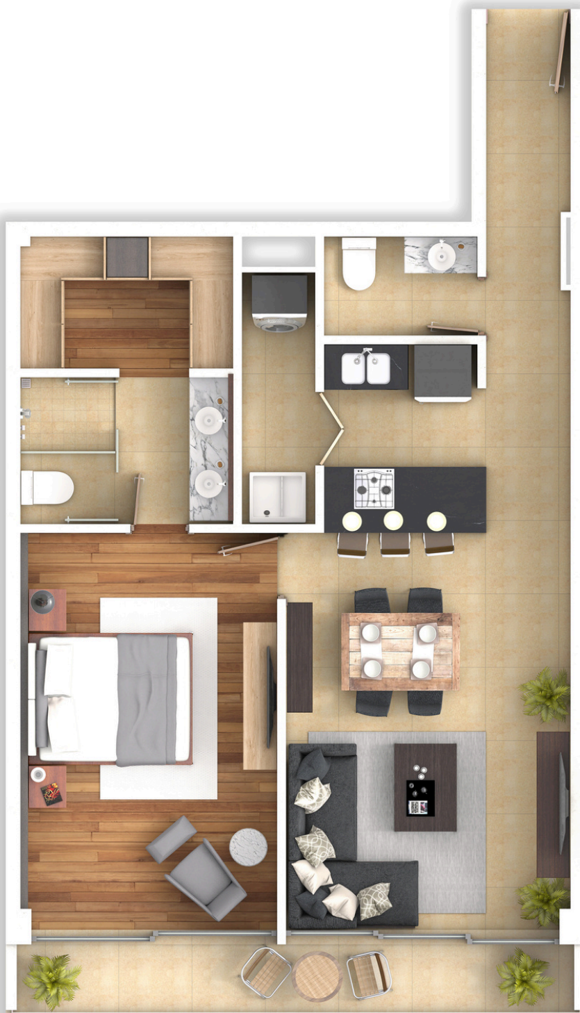
VISTA A JARDÍN INTERIOR