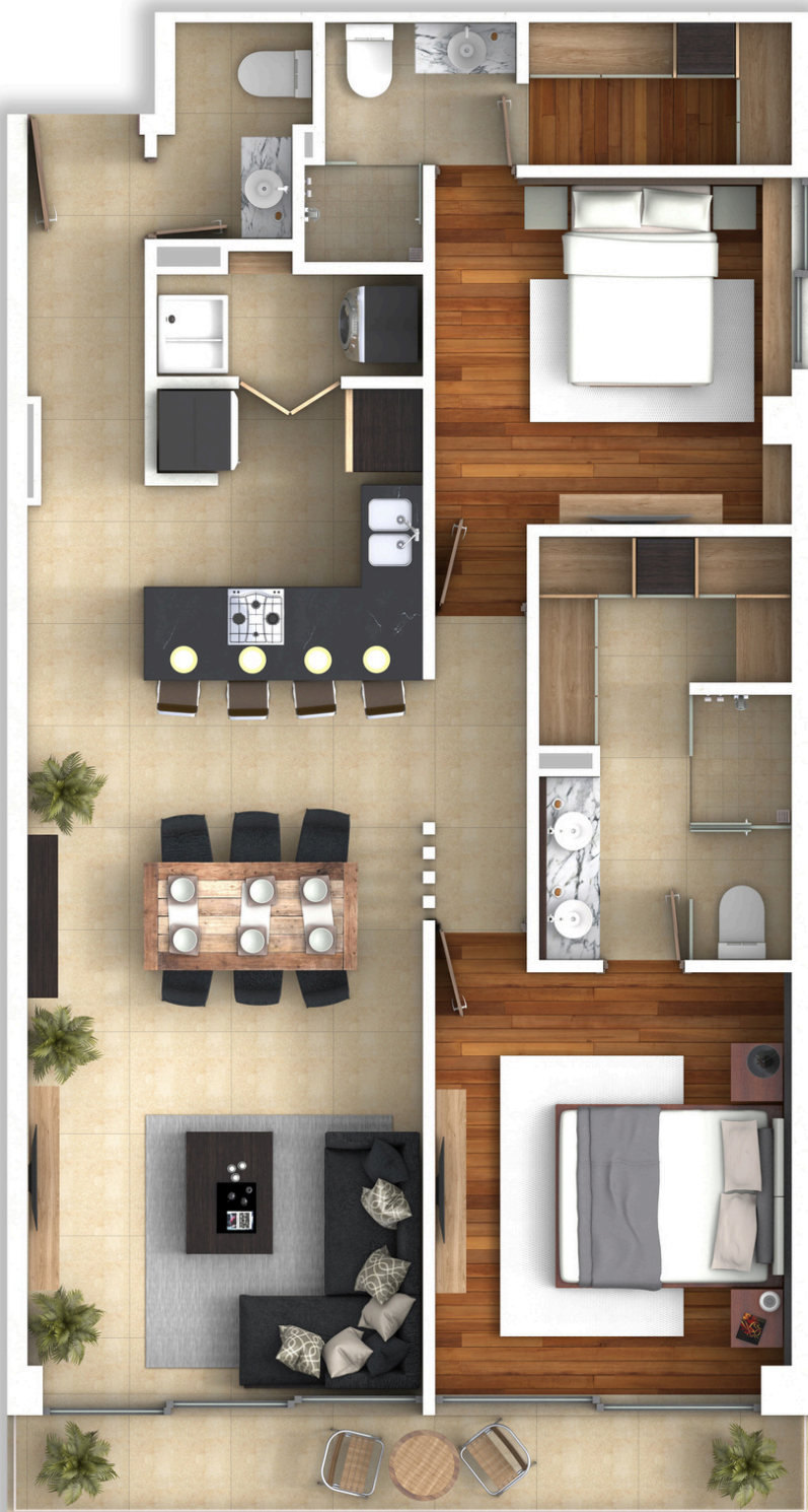
VISTA A JARDÍN INTERIOR